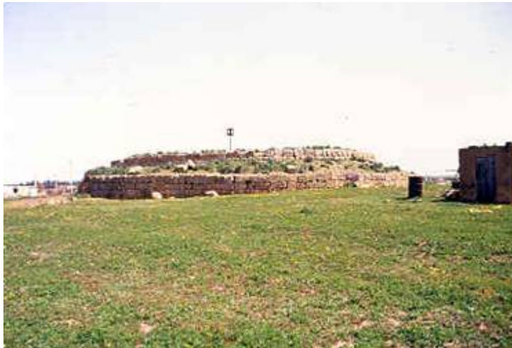
Le site du Mausolé El Gour