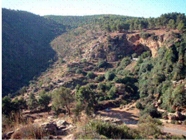
Vu Générale de la grotte des Pigeons à Taforalt