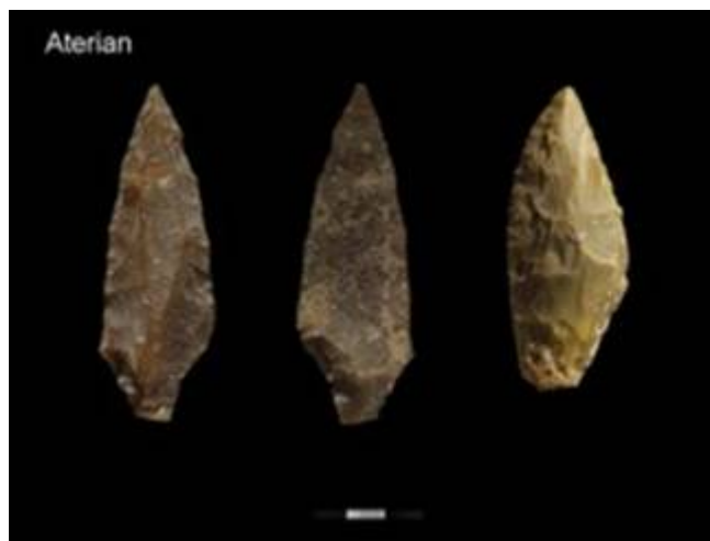
Outils lithiques découverts dans la grotte des Pigeons à Taforalt