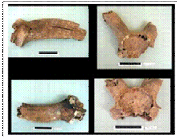
Cornes de Mouflon à manchette Grotte des Pigeons à Tatoralt