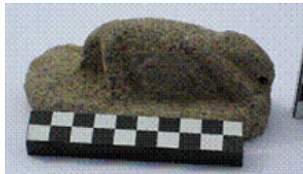
Statuette en basalte d'un animal accroupi (Eléphant ?).