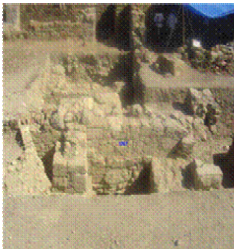
Vue sur le secteur de fouille