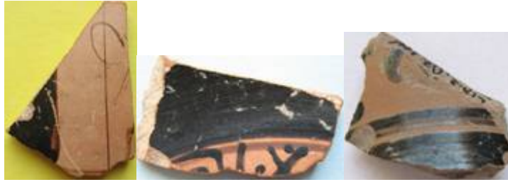
Quelques fragments de céramique antique du Vème-IVème s. av.J.-C