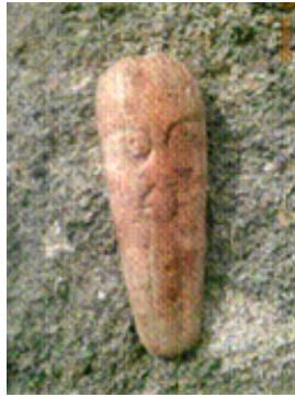
Elément de collier en ivoire représentant un personnage barbu.